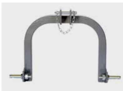
Attacco Cat. 1 3-point linkage Cat. 1 3-Punkt Anbau Kat. 1 Attelage à 3 points Cat. 1