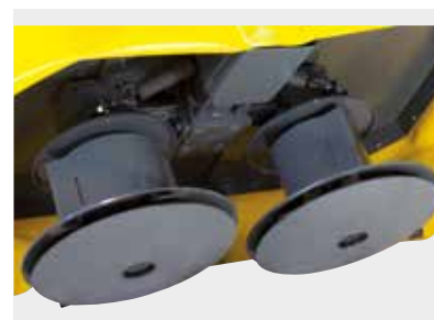
Tamburi e dischi con coltello oscillante Drums and discs with swivel retractable blades Trommeln und Scheiben mit einziehbaren Klingen Tambours et disques avec couteaux oscillants